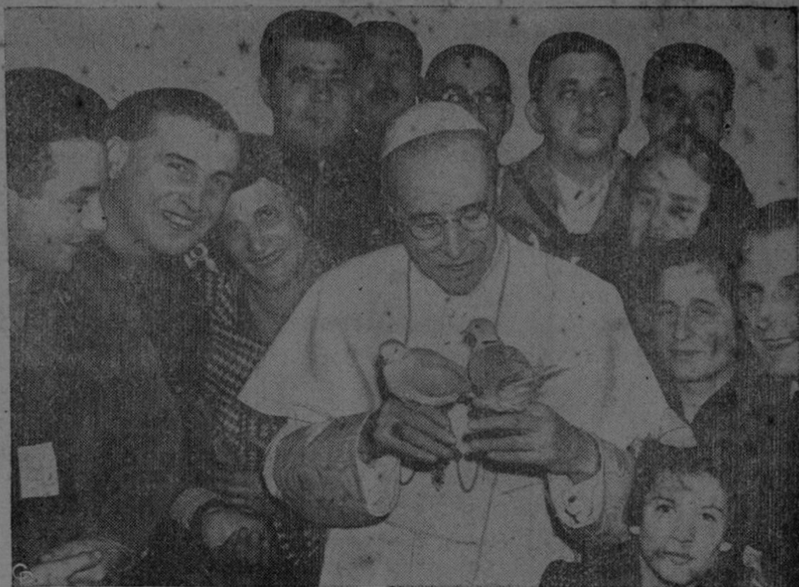
Dos palomas, símbolos de la paz, son obsequiadas al Papa Pio XII por la Tercera Orden de Franciscanos en una audiencia especial en San Pedro, Roma.

Su Director es un hombre pobre que no la puede pagar de su bolsillo, ya que apenas nos da para pagar la imprenta y para medio vivir. Escribanos pronto a vuelta de correo; díganos con cuánto cotiza y nosotros le pagaremos su favor con anuncios.